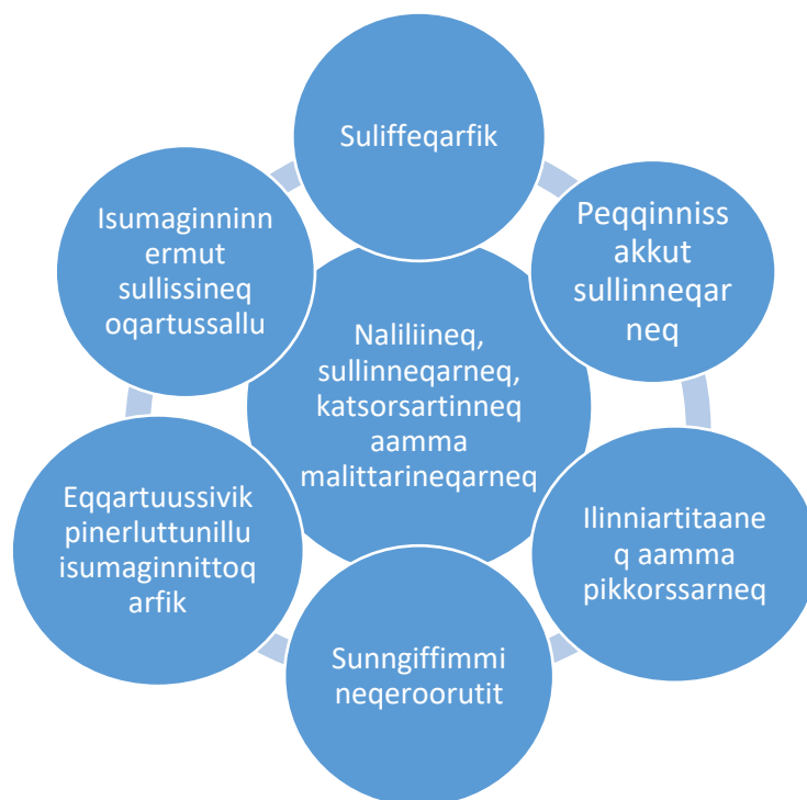
Takussutissiaq 7.1 Suliniut pitsaarnepaaq katsorsaarnermik neqeroorutillu allat inuusuttup pisariaqartitaanik naapitsisut ataqtigiissinnerinik neqerooruteqarpoq (57 malillugu).

Katsorsaarnep neqeroorutillu allat ataqtigiissinerinik neqerooruteqarneq suliniutaavoq pitsaarnepaaq, inuusuttup suliniummik pisariaqartitsinera aangajaarniutitik atuinngiffiusumik inuunermut nutaamut ataqtigiissisinnasooq aamma inuusuttup atugarissaarnera, inuunerata pitsaassusaa, imminut isumassornera qaffatsillugu kiisalu aangajaarniutit avataanni inuusuttunut allanut inuusuttoq atassuteqalersillugu Pingaartumik immikkoortut ilinniartitaanerup/pikkorissarnerup, suliffeqarnerup, isumalimmik sunngiffimmi neqeroorutit, peqqinnissakut sullinneqarnerup, isumaginninnermi sullinneqarnerup aamma eqqartuussiviit /pinerluttunik isumaginnittut iluini suliniutit inuusuttumut tapersersuisinnaapput (Takussutissiaq 7.1).